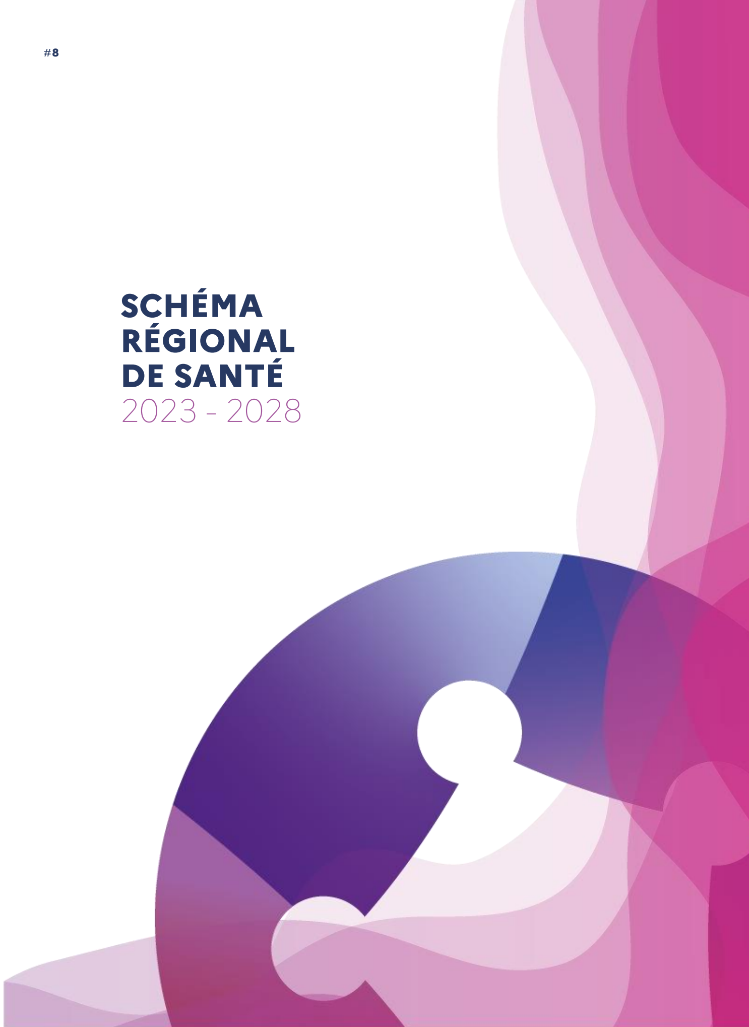
SCHÉMA RÉGIONAL DE SANTÉ 2023 - 2028